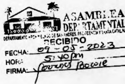
EVERTH HAWKINS SJOGREEN Gobernador

Anexos: 12 ejemplares de Proyecto de Ordenanza y la Exposición de Motivos, con USB. -12